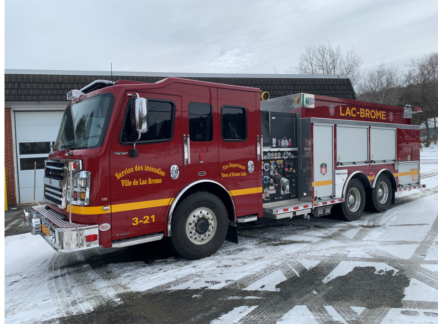
Camion incendie Fire truck 1,4 M$